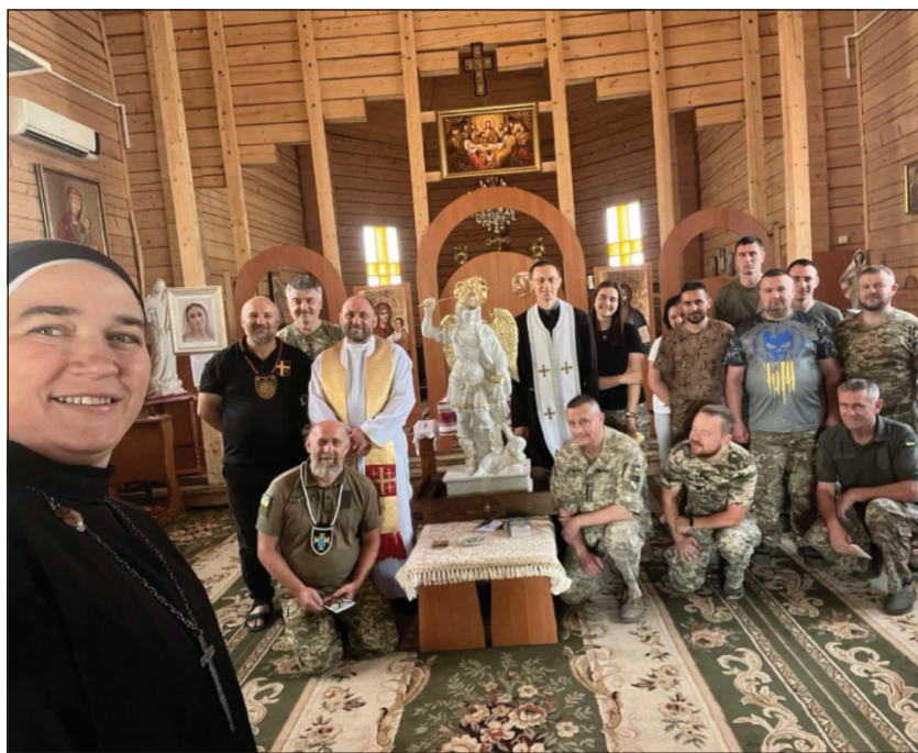
Figura patrona z Gargano zamieszkała odtąd w Słowińsku, a Rycerze regularnie wracają, by modlić się przy niej z żołnierzami i zabierać ją do innych przyfrontowych miast. Takich wyjazdów było już kilkadziesiąt. W uroczystość Niepokalanego Poczęcia