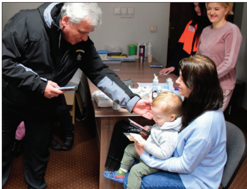
Kard. Krajewski spędził Wigilię Bożego Narodzenia 2024 r. w Charkowie

czas wszystkich audiencji od trzech lat modli się w intencji Ukrainy. „Przypomina w ten sposób wszystkim, by nie zapomnieć o tym kraju, który został tak brutalnie potraktowany trzy lata temu” – zauważa kard. Krajewski.