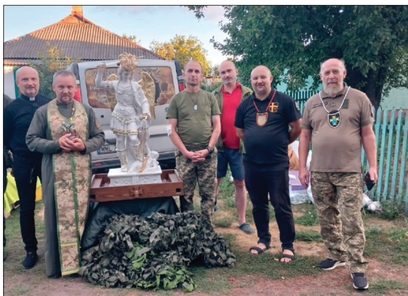
Figura św. Michała Archaniola eskortowana przez Rycerzy św. Jana Pawła II

Modlącym się nic się wówczas stało, a „miasto duchów”, jak nazywany jest Pokrowsk ze względu na exodus mieszkańców, do dziś nie został zdobyty, pomimo wielu okrutnych prób. „Jestem przekonany, że to cud św. Michała” – mówi Włodzimierz.